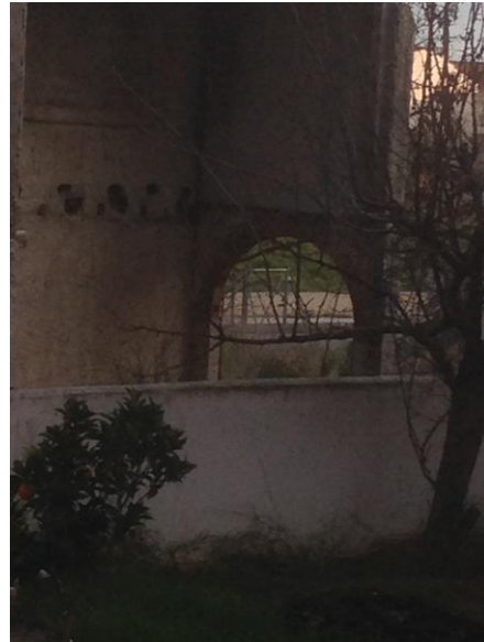
Όταν ανοίγεις μια πόρτα, βρίσκεσαι μπροστά σε μια άλλη